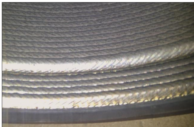
Trubkovnice se 2 vrstvami plátů.

Společnost ESAB působí na předním místě v technologii svařování a řezání. Již před sto let nepřetržitě zdokonalování výrobků a procesů nám umožňuje řešit problémy technologického pokroku v každém odvětví, ve kterém působíme.