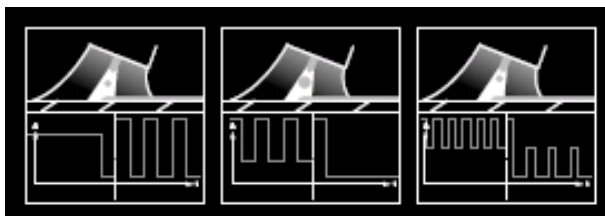
Aristo ® U8 2 Plus podporuje SuperPulse ™

S rozšířenou pamětí a vylepšeným displejem, může být v panelu Aristo ® U8 2 nastaven jeden ze sedmnácti komunikačních jazyků včetně originální Ruštiny a Čínštiny. Manuály jsou rovněž dodávány ve všech těchto jazycích. Zapomeňte na zmatky při nastavení a nečitelné displeje s novým pendantem Aristo ® U8 2 !